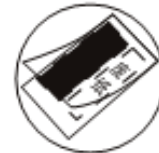
当护卡膜大小不合适时(图A)