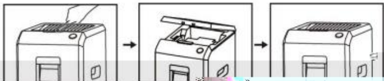
按下红色紧急按钮，关闭